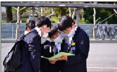
自分の学級を探している様子

また、式終了後のPTA学級委員決めにおいては、各学級5名の委員選出を短時間で行っていただきました。保護者の皆様のご協力に心より感謝申し上げます。