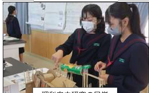
理科自由研究の見学