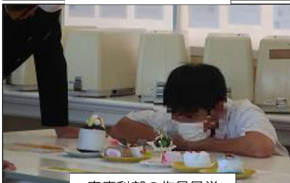
家庭科部の作品見学