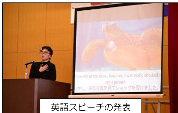
英語スピーチの発表